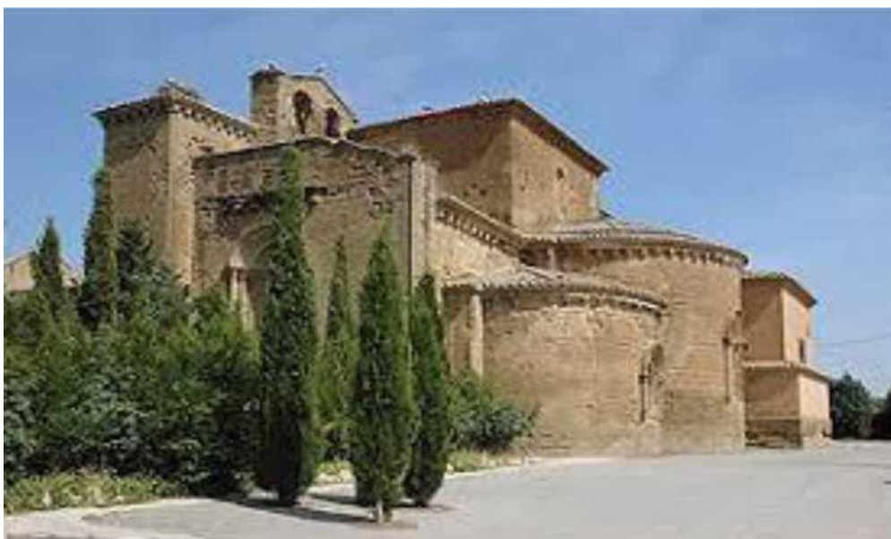
Aspecto actual del monasterio, desde el vial por el que se accede.