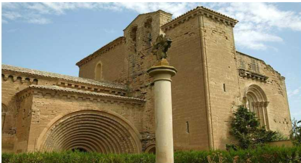
Vista desde el acceso al monasterio en su estado actual