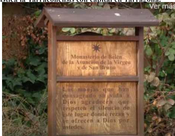
Cartel anunciador del Monasterio de Belén

La Constitución Española de 1978 se abstuvo de establecer un mapa regional de España admitiendo, en su lugar, la instauración de Comunidades Autónomas en todos los territorios que la sentían, con los riesgos de la proliferación de Comunidades Autónomas uniprovinciales (7 de las 17 lo son), y que algunas provincias con ambigua personalidad, quedasen descolgadas frente a las autonomías vecinas. Tras los pactos autonómicos de 1981 y 1992, España quedó organizada en 17 Comunidades Autónomas, incluyendo una Comunidad Foral (Navarra), y dos ciudades autónomas (Ceuta y Melilla). Cada Comunidad Autónoma está formada por una o más provincias, hasta un total de 50 en el territorio nacional. Si se mantuvo en la provincia de Zaragoza, pero la diócesis seguía siendo la Lérida y la provincia eclesiástica la Tarraconensis con capital en Tarragona.