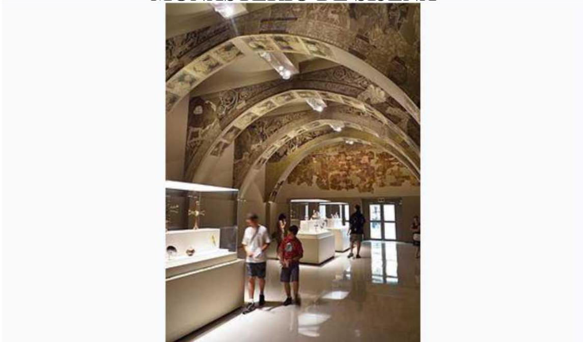
Pinturas procedentes de la sala capitular conservadas en el MNAC .

No podemos iniciar esta presentation sin reconocer que en la parte oriental de la Comunidad autonoma de Aragon, hay una franja territorial, denominada «Franja de Aragon», «Franja de Poniente», «Franja Orientals, «Marcas de Poniente», «Marcas de Aragon» o incluso «La Raya de Aragon».