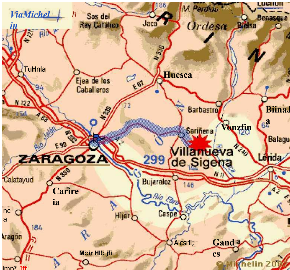
Situación de Villanueva de Sigüenza en el contexto territorial. Entre Bujaraloz y Caspe, encontramos el Monasterio de Rueda, premio europeo a la restauración monumental.