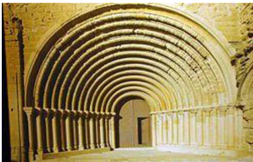
Aspecto del estado actual del portal romanico de la Iglesia del Monasterio