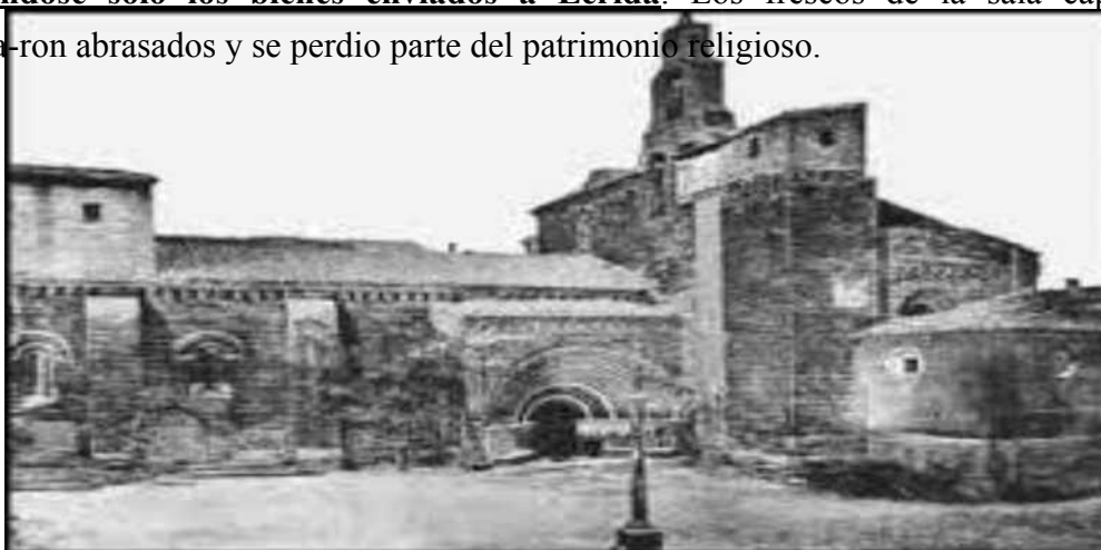
Aspecto del Monasterio de Santa Maria de Sijena, anterior a su actual reconstruccion

Al inicio de la Guerra Civil el monasterio fue incendiado y su patrimonio arrasado, salvandose solo los bienes enviados a Lerida . Los frescos de la sala capitular quedaron abrasados y se perdio parte del patrimonio religioso.