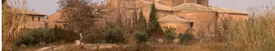
Detalle de la parte posterior del Monasterio

El ultimo capitulo en la devolucion se escribio el 11 de diciembre de 2017 cuando tec-nicos de patrimonio de la DGA, escoltados por la Guardia Civil, trasladaron atrasladaron a Siiena las 43 piezas que el Museo de Lerida aun mantenia . Pero el lienzo de la Inmaculada del siglo XVIII no se encontro en el museo, hasta que hallado cuatro dias mas tarde en el Palacio Episcopal , fue trasladado a Siiena el 23 de enero de 2018.