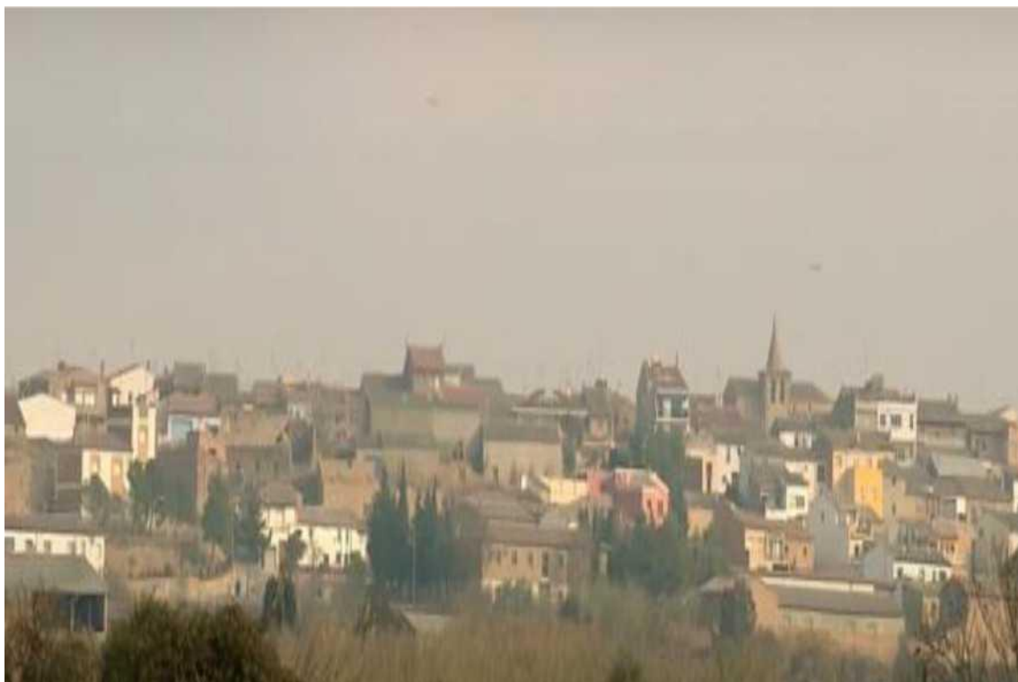
Vista general de la población de Villanueva de Sigüenza, en la Franja de Ponent.

https://www.heraldo.es/especiales/bienes-aragon/siiena.html