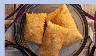
risóis se leiteão