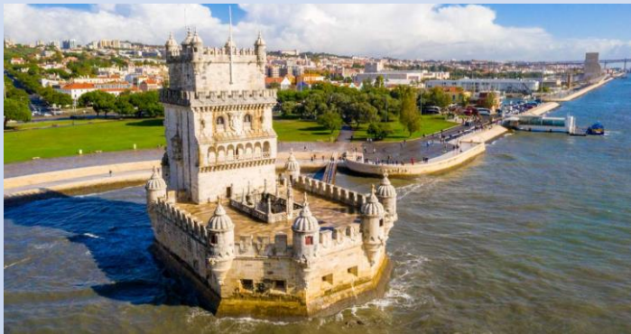
Torre de Belem (1516)

Los azulejos están presentes desde el principio, como forma de decoración