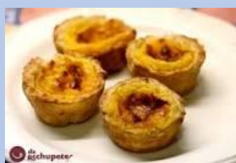
pasteis de belem

Acompañamos la proyección con una degustación de productos autoctonos portugueses: