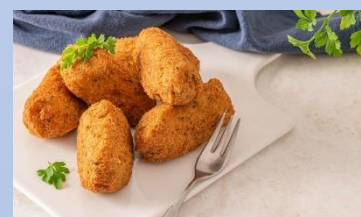
bolinhos de bacalhau