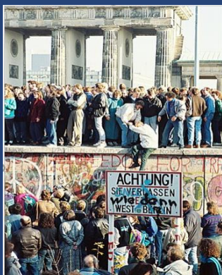
La caída del Muro de Berlín fue uno de los sucesos que revelaron los cambios en la RDA