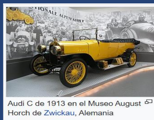
Audi C de 1913 en el Museo August Horch de Zwickau, Alemania