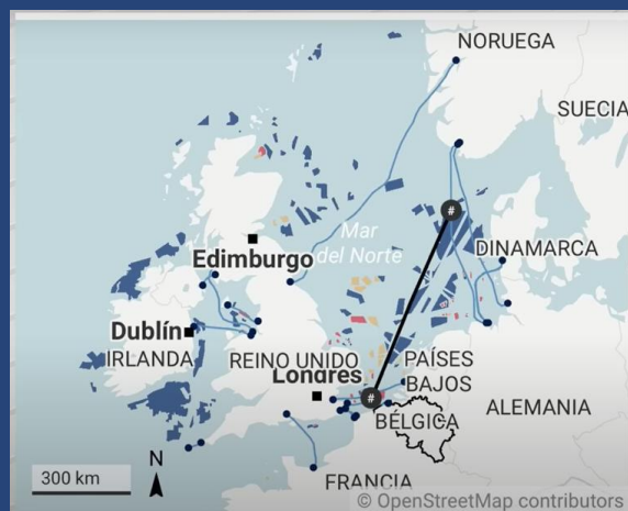
Mapa Instalación Eólica propuesta por Alemania