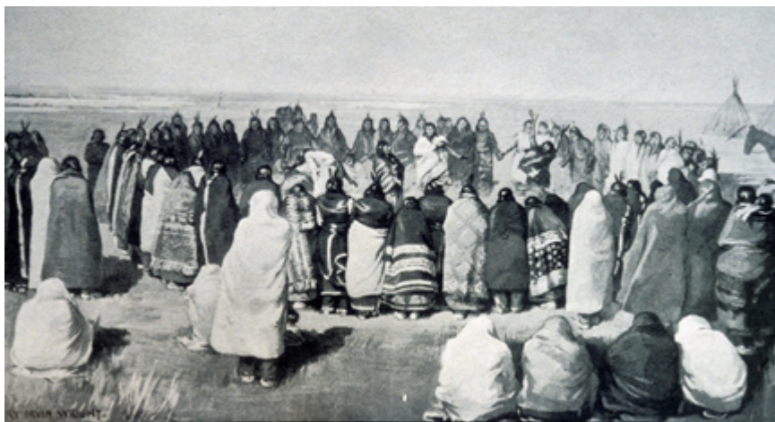
e), Wovoka (Jack Wilson).

Los valores europeos y los nativos crearon una nueva cultura, también la religión. Las tierras que habían pertenecido a los nativos, habitualmente en el nativo una religión, fueron quitados por los europeos. Poco a poco se fue la reivindicación de los antiguos valores, basados en las que el indio era el protagonista. También sincretismo, aunque en la antropología no gusta mucho este término, por lo que se verá.