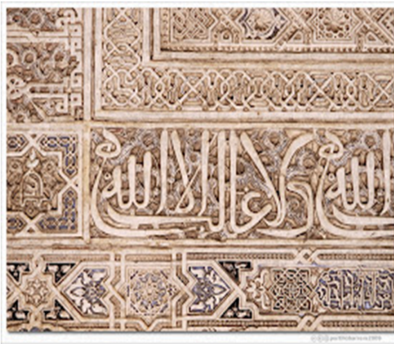
Decoracion geometrica Islam España