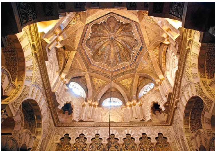
Cúpula de la Mezquita de Córdoba