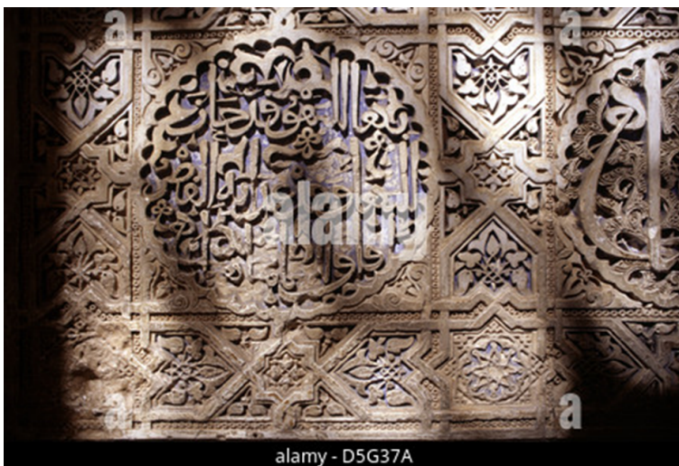
Decoracion época Nazarí

La decoración abundante y minuciosa se hace con materiales blandos como el yeso.