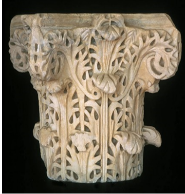
Capitel Califal Cordobés