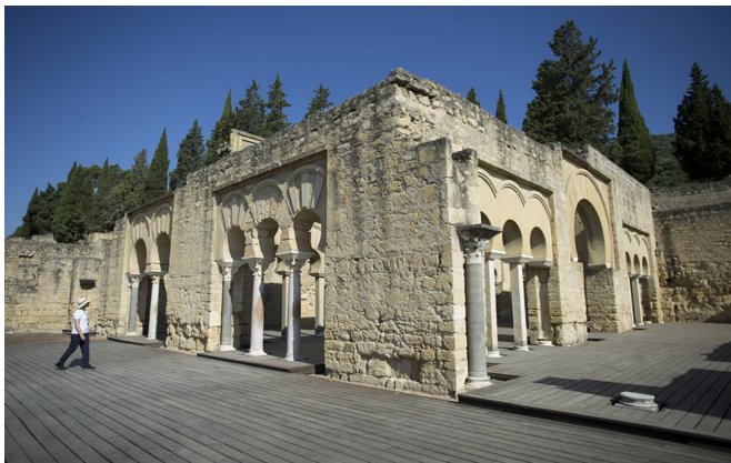
Palacio de Medina Azahara

Disponían de preciosos jardines donde el agua tenía una importancia primordial, los mejores ejemplos son la Alhambra de Granada y el Generalife.