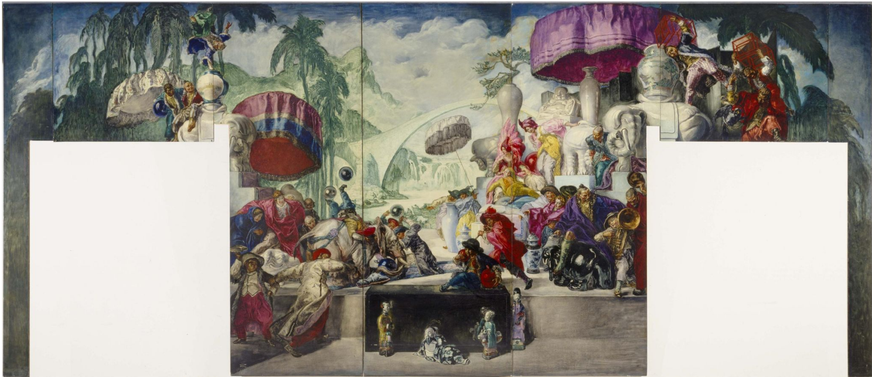
La primavera o Asia, 1917-20